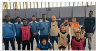
Le tournoi de futsal inclusif s'est déroulé au gymnase Gérard-Philips.

Faire jouer au sein de la même équipe un Chef d'entreprise, une personne handicapée, un enfant, un adulte ; faire travailler ensemble des participants qui n'ont pas l'habitude de le faire « et permettre à tout un chacun de découvrir le futsal. Tel est le pari, multiple, tenu par Orléans Futsal.