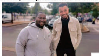
Il n'y a pas d'argent dans le futsal, mais il y a beaucoup d'expérience.

« Nous avons pu le compte d'observer ce qui se passe au niveau des clubs de la métropole avant de nous lancer dans le bain. Nous sommes assez de nous être beaucoup d'expérience pour mener notre challenge », explique-t-il. Le challenge que ces deux jeunes, issus de l'Argonne pour le président et de la Source, pour le second, ont décidé de relever est double.