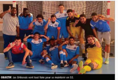
OBJECTIF. Les Orléanais vont tout faire pour se maintenir en D2.

Tout juste promu en D2 et dans une poule relevée, Orléans Futsal compte bien évoluer dans le championnat et vise avant tout le maintien.